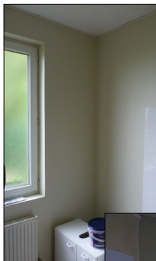
Photos après travaux

➤ Eco-prêt à taux zéro: 24 198.00 € ➤ Apport personnel : 0.00 €